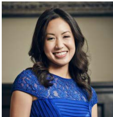
翠怀恩·农 Chantal Nong

华纳 DC 副总裁，曾任华纳影业副总裁多年，主导制作的电影包括《巨齿鲨》、《摘金奇缘》、新《哥斯拉》系列、《300 勇士：帝国崛起》、《实习生》等。