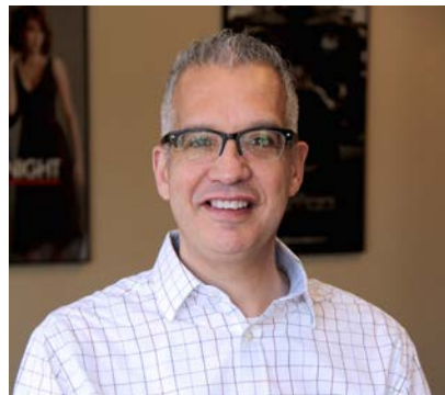
艾文·贝拉得杰 Irving Belateche

南加大最受好评的编剧老师、编剧、作家。他不仅为顶尖电影制作公司如派拉蒙、索尼、华纳兄弟和电视网络如 HBO, Syfy (NBC 奇幻频道) 撰写剧本，也是畅销书《爱因斯坦的秘密》和《H2O》的作者。他的十七部已售出的长片剧本中包括《极品飞车》《完美孕期》等。曾合作过的知名制作人和导演包括劳伦斯·班德(《低俗小说》)、乔·西韦尔(《骇客帝国》)、罗伯特·伊万斯(《罗斯玛丽的婴儿》)、杰森·布鲁姆(《爆裂鼓手》、《鬼影实录》)、罗伯特·泽米吉斯(《阿甘正传》、《回到未来》)、罗兰·艾默里奇(《独立日》)等。